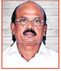
பா. சேவியர் மரியநாதபுரம், திண்டுக்கல்

தி.ப. 9 : 26-31, 1யோவா. 3 : 18-24, யோவா. 15 : 1-8